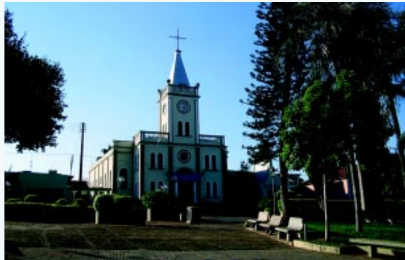
Praça da Matriz onde ocorre a Festa da Padroeira Santa Rita de Cássia