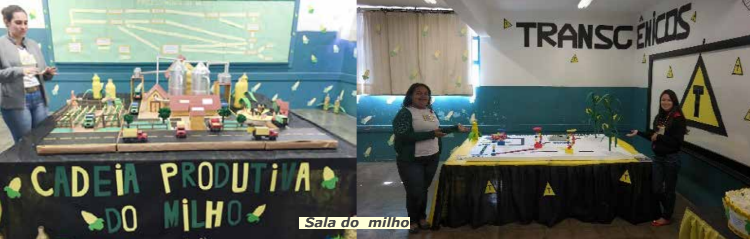
Sala do milho

A sala do milho abrigou toda a cadeia produtiva, além das principais formas de consumo do grão. A professora de Biologia abordou, sem ideologias, a questão da transgenia, falando da história, dos resultados e mostrando as diversas opiniões sobre o tema. A compostagem foi outro tema no ambiente da agricultura familiar.