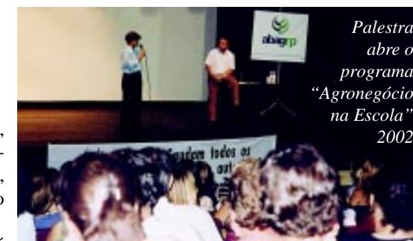
Palestra abre o programa “Agronegócio na Escola” 2002

se transformam em educação, saúde, cultura... bem-estar social.