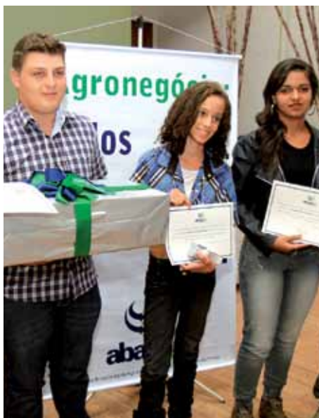
Vencedores do XI Concurso de Frases e Desenhos

O encerramento do Programa Educacional “Agronegócio na Escola” foi mais que um espaço para premiação. O evento não só comemorou os bons resultados obtidos ao longo de 2012 como serviu para refletir os avanços obtidos e os desafios que se impõe para o futuro.